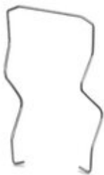
Крепление реле, проволочное исполнение, для октальных реле высотой 52 мм

Обратите внимание на то, что приведенные здесь данные взяты из online-каталога. Полная информация и данные содержатся в документации пользователя. Действуют Общие условия использования для информации, загруженной из интернета. ( http://phoenixcontact.ru/download )