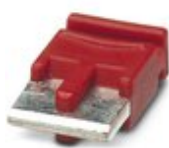
Перемычка, цвет: красный