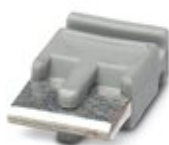
Перемычка, цвет: серый