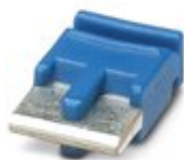
Перемычка, цвет: синий