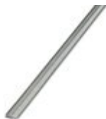
Нарезаемые перемычки, цвет: серый

Нарезаемые перемычки - FBST 500-PLC GY - 2966838