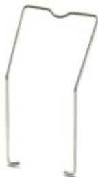
Проволочное крепление реле, используется для релейных разъемов ECOR-2

Обратите внимание на то, что приведенные здесь данные взяты из online-каталога. Полная информация и данные содержатся в документации пользователя. Действуют Общие условия использования для информации, загруженной из интернета. ( http://phoenixcontact.ru/download )