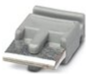
Переключатель, цвет: серый