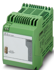
Энергоаккумулятор, свинцово-кислотный, технология VRLA, 24 В DC, 0,8 А-ч.

Обратите внимание на то, что приведенные здесь данные взяты из online-каталога. Полная информация и данные содержатся в документации пользователя. Действуют Общие условия использования для информации, загруженной из интернета. ( http://phoenixcontact.ru/download )